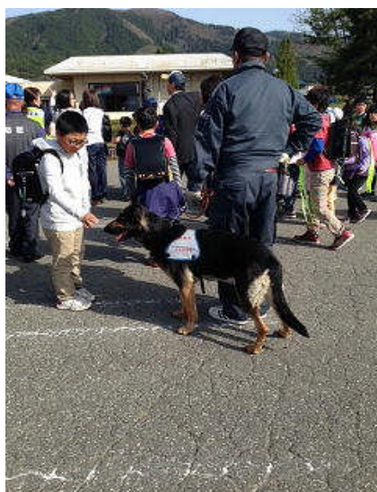
【たくまっ子見守り隊出発式】