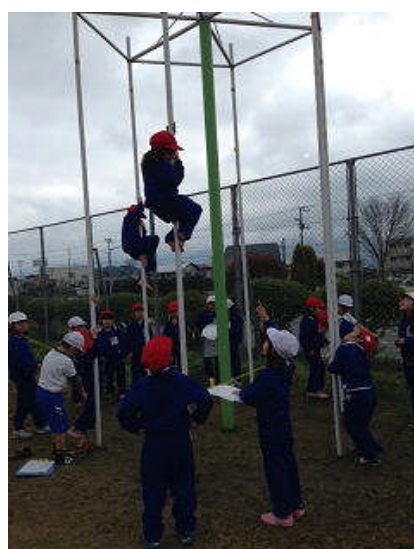
【遊具で力いっぱい遊ぼう】

校是 「琢磨」 知徳ヲ切磋琢磨シテ有用ノ人材ヲ かしこく つよく えがお輝く たくまっ子