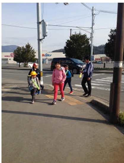
【安全に登校しよう】