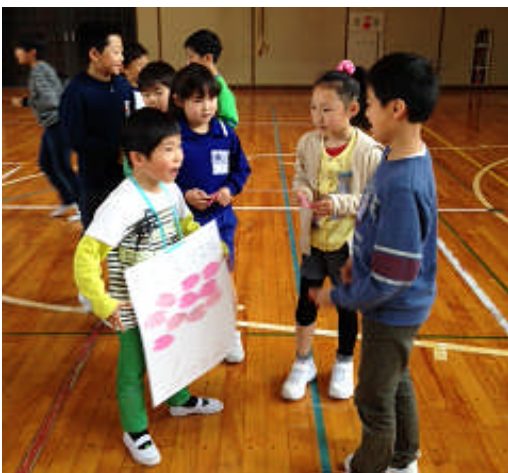
一年生を迎える会から 楽しいゲームに大満足の1年生